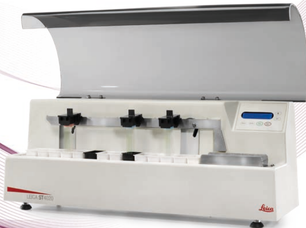
1 オプションのフード付きLeica ST4020 Linear Stainer