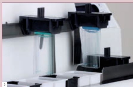
2 スライドキャリア/ラックにつきスライドラック×4、スライド×4