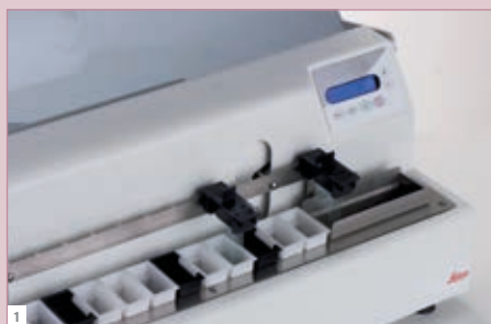
1 16枚のスライド用の回収タンク